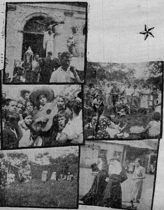
Superior, izquierda: la procesión de Santo Cristo de Espinulas, en Alajuela, se inicia; hacia abajo: un trovador hace las delicias de la chiquillería; visitantes de la capital se entregan a los ejercicios atléticos, en un rincón de la pintoresca Alajuela. Derecha, arriba: mientras se almuerza los trovadores rasgan las cuerdas de las guitarras y entonan románticas canciones. Dos monjitas dirigiéndose a visitar a Santo Cristo.

La fuerza del viento los lanza contra el interior de los vehículos, siendo esto lo más molesto. Se hace necesario cerrar todos los vidrios de los carros para impedir que sean introducidos en la